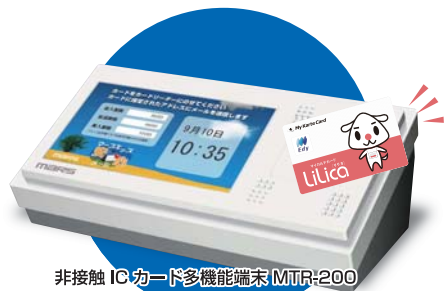
非接触 IC カード多機能端末 MTR-200

メールアドレス等はカードに格納しますので情報を管理する 必要はありません。サーバが不要でオフラインでも情報が読み出せます。 災害時に避難所などに収容された場合も対応することができます。