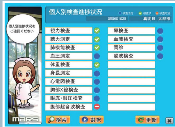
個人別検査進捗状況