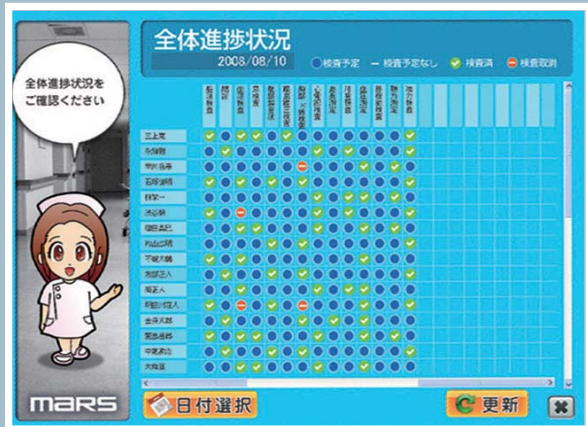
全体進捗状況一覧