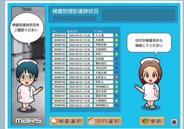
検査別受診進捗一覧